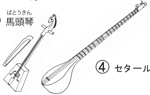
③ ばとうきん 馬頭琴