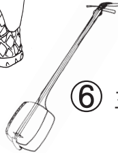
⑥ しゃみせん 三味線